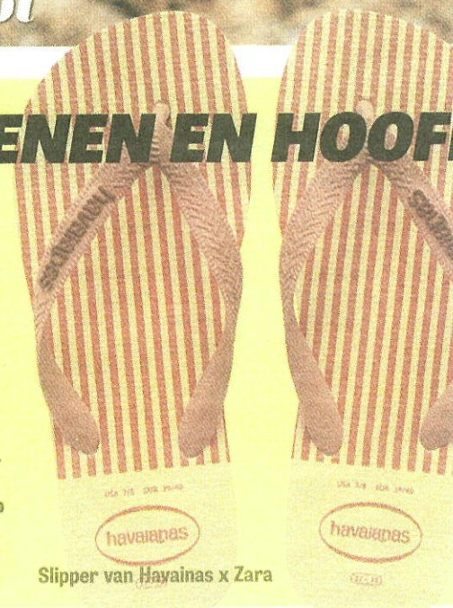
Slipper van Havaianas x Zara

werking met Zara een unieke slipper ontworpen, passend bij de strepen, bloemenprints en zachte tinten van dit seizoen. Gladde benen staan natuurlijk ook op de zomerse wishlist . Ontharen met een loeischerp mesje en luchtige scheerschuim is nog steeds de snelste methode. De stoppels dienen zich alleen wel snel weer aan, dus voor de lange termijn optie is het pijnlijke epileren een mogelijkheid, net als waxen of harsen. Een kwestie van even op de tanden bijten, maar dan ben je er ook een paar weken vanaf. Permanent weglaseren is ook een prima