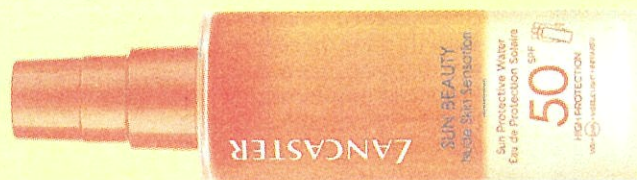
Zonwater van Lancaster