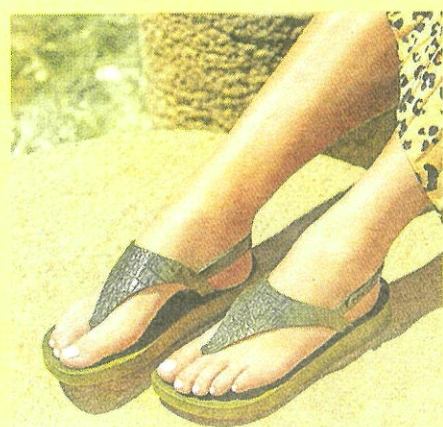
Slipper van Ipanema

„Vrouwen vinden hun eigen lichaam vaak niet mooi”